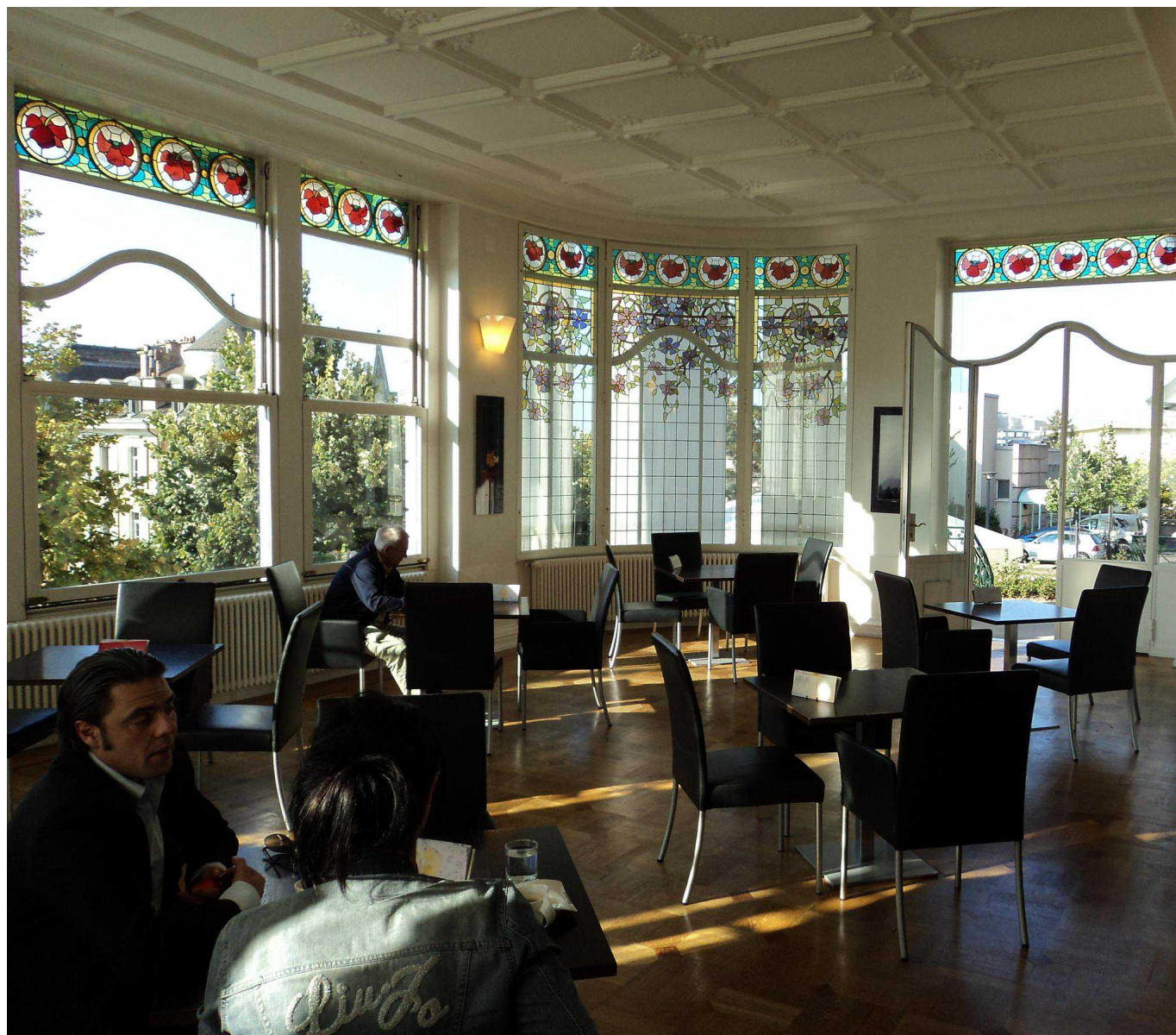
Бывший ресторан гостиницы "Сесиль", ныне кафетерий клиники "Сесиль", Лозанна. Фото автора, октябрь 2011 г.

История о том, как эпизод русской истории выплеснулся на территорию Швейцарии, и личная месть привела к разрыву отношений между двумя странами на долгие годы.