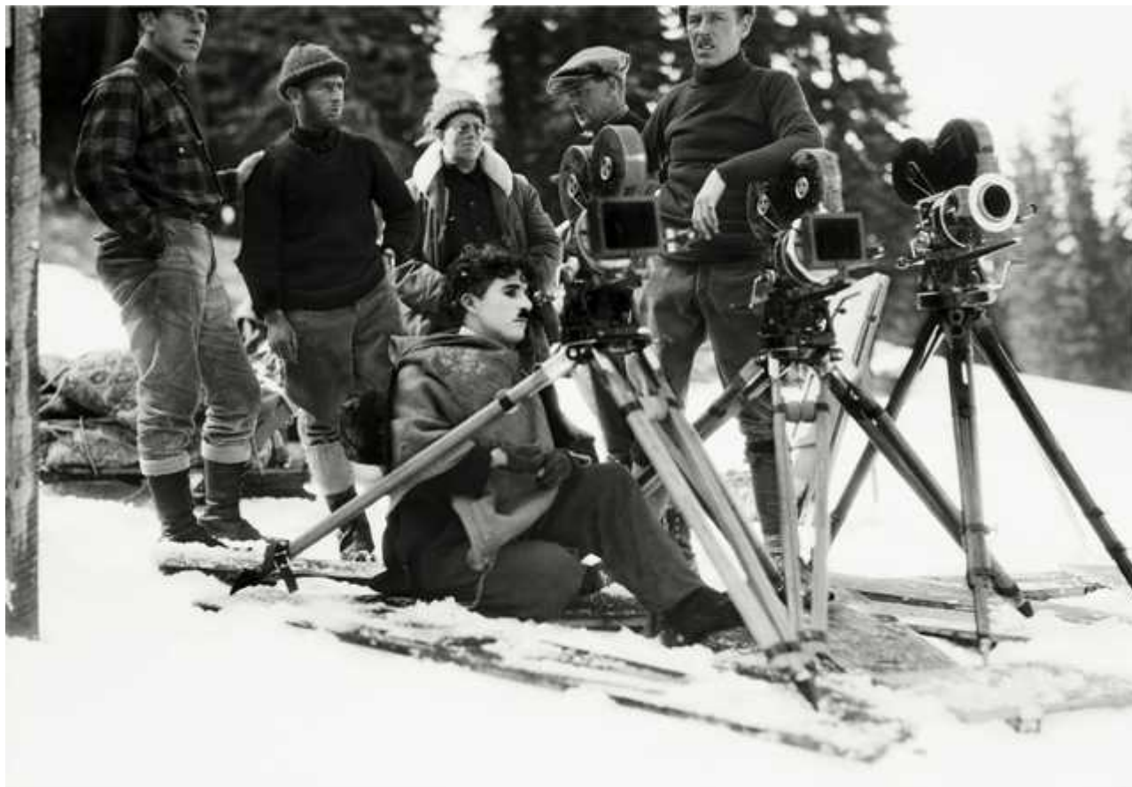
Чарли Чаплин на съемках фильма "Золотая лихорадка"(The Gold Rush) с ассистентом Эдди Сазерлендом (слева), Truckee, California (avril 1924) © Roy Export Company Establishment, с разрешения Musée de l'Élysée, Lausanne

Source URL: https://dev.nashagazeta.ch/news/12839