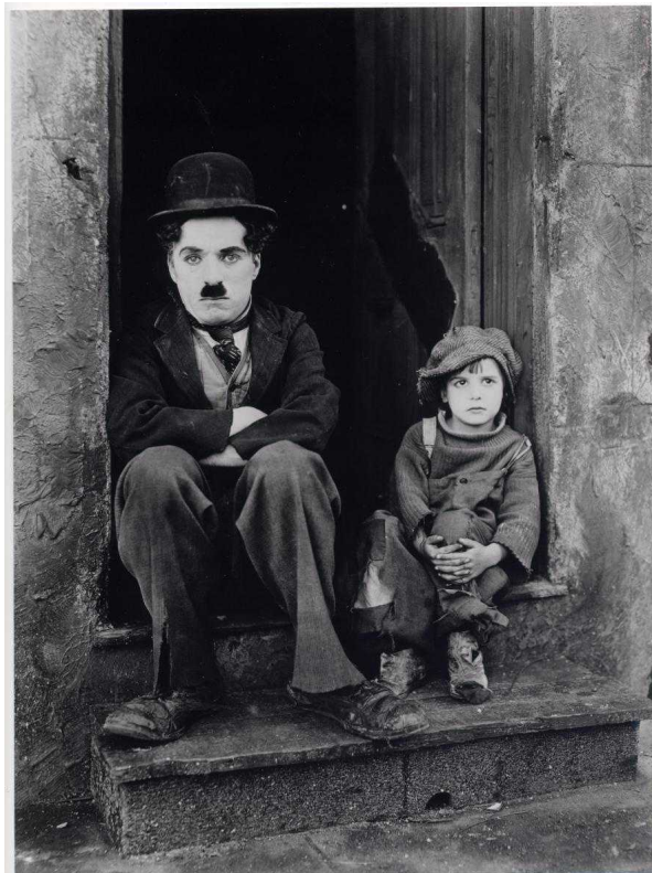
Чарли Чаплин и Джеки Куган, "Малыш"(The Kid) (1921) © Roy Export S.A.S, с