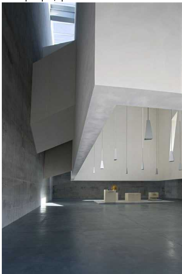
Интерьер церкви в Фолиньо

Понятно, что небольшая церковь в швейцарской провинции совсем не стала новатором в области развития архитектурных особенностей религиозных