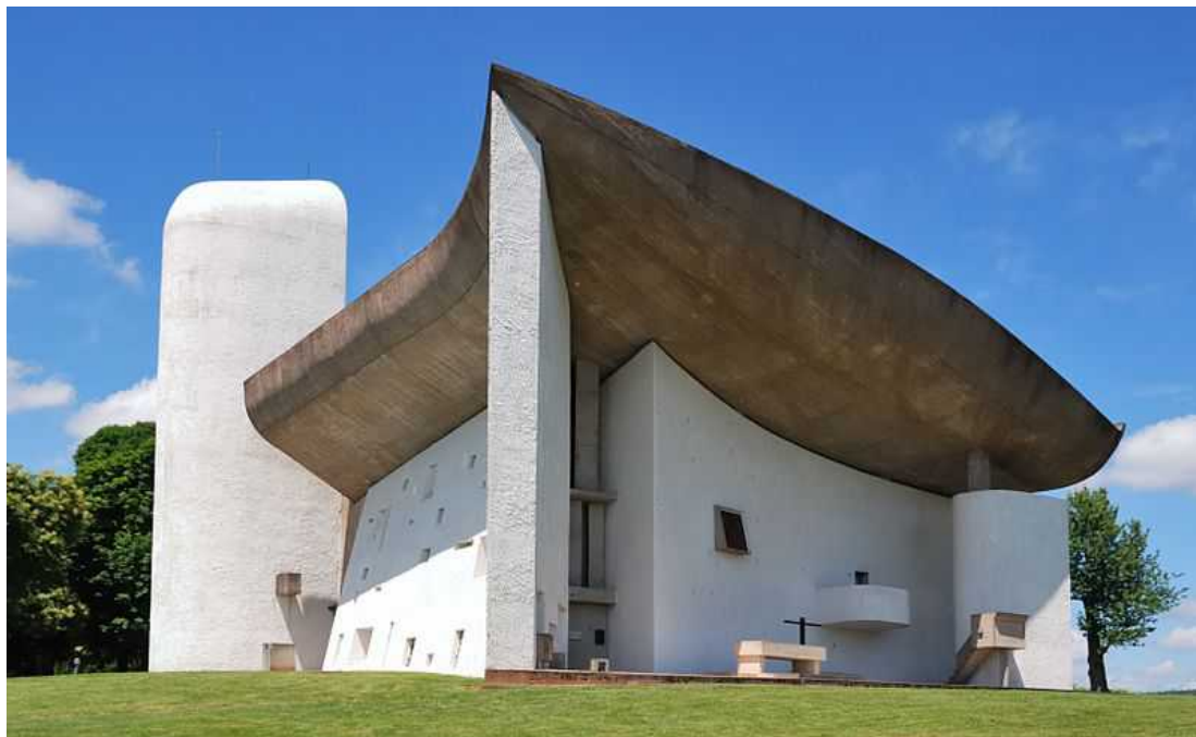
Нотр-Дам-дю-О в Роншане

Это только небольшой обзор некоторых необычных церквей мира. И Мариенкирхе в Замстагерне уступает по силе эстетического воздействия и величественности многим своим тезкам. Но скромных прихожан это совсем не смущает. Им кажется, что гораздо важнее - с чем человек приходит в церковь, а какие формы здание может принимать - вопрос второстепенный.