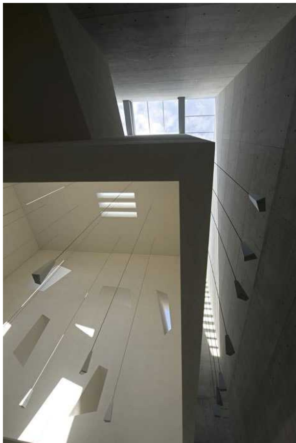
Интерьер церкви в Фолиньо