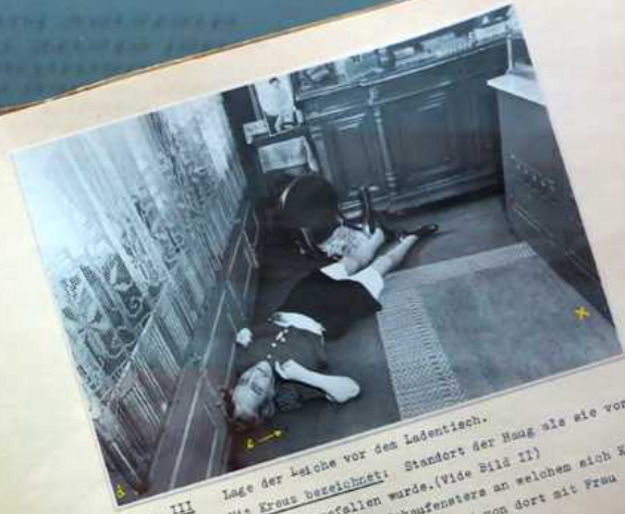
Bild : III