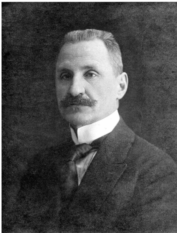
С.А. Бутурлин. Москва, 1918 г.

Александровича по написанию многотомного определителя птиц России близилась к завершению. Первая мировая война и наступление германских войск в Прибалтике вынудили его позаботиться о своем научном архиве и собранной им коллекции птиц, насчитывавшей уже двенадцать тысяч экземпляров. Большую часть коллекции он передал в Зоологический музей Московского университета, а научный архив отправил подальше от линии фронта, в Симбирскую губернию, под присмотр соседей по имени Кротковых. В 1918 году, когда началась экспроприация дворянских имений, ящики с упакованными научными материалами вместе с другим имуществом были вывезены из имения Кротковых, и научный архив Бутурлина попал в Карсунский отдел народного образования. Оттуда часть его передали в уездные школы, но основное успели вывезти в Симбирский народный музей (ныне Ульяновский областной краеведческий музей), где он сейчас хранится.