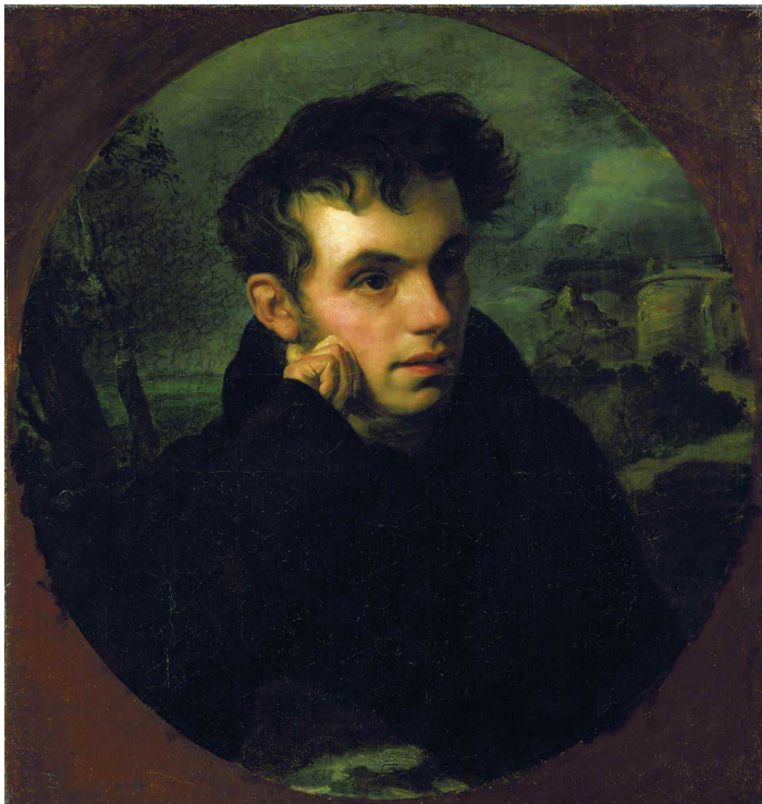
Орест Кипренский. Портрет Василия Жуковского. 1816 год

Некоторых Швейцария меняла, а некоторые сами стремились изменить Конфедерацию. Отец анархизма Бакунин провел немало времени в Берне и Цюрихе. Выступая с лекциями и публикуя свои статьи, он надеялся вдохновить местных рабочих принять участие в мировой революции. Правда, очень скоро он разочаровался в швейцарском пролетариате, который не хотел никаких социальных потрясений: в отличие от товарищей в России, бернским рабочим было что терять. Горячо проповедовал свои идеи и бежавший в Локарно теоретик анархизма, революционер князь Петр Кропоткин.