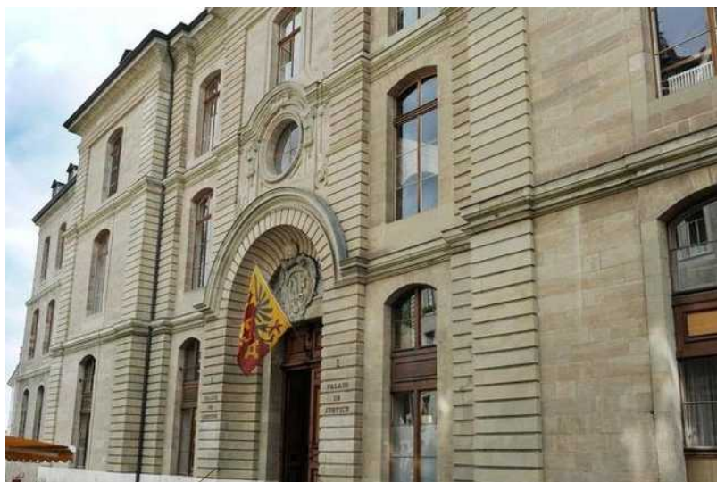
Женевский дворец правосудия