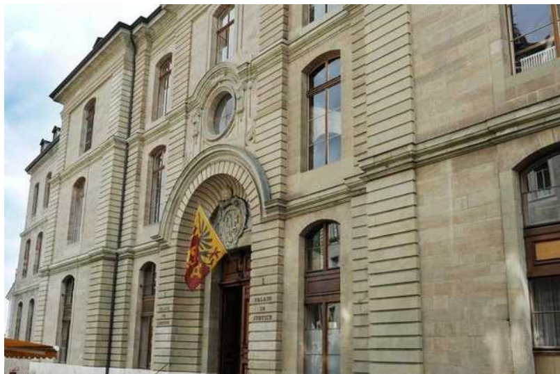
Женевский дворец правосудия