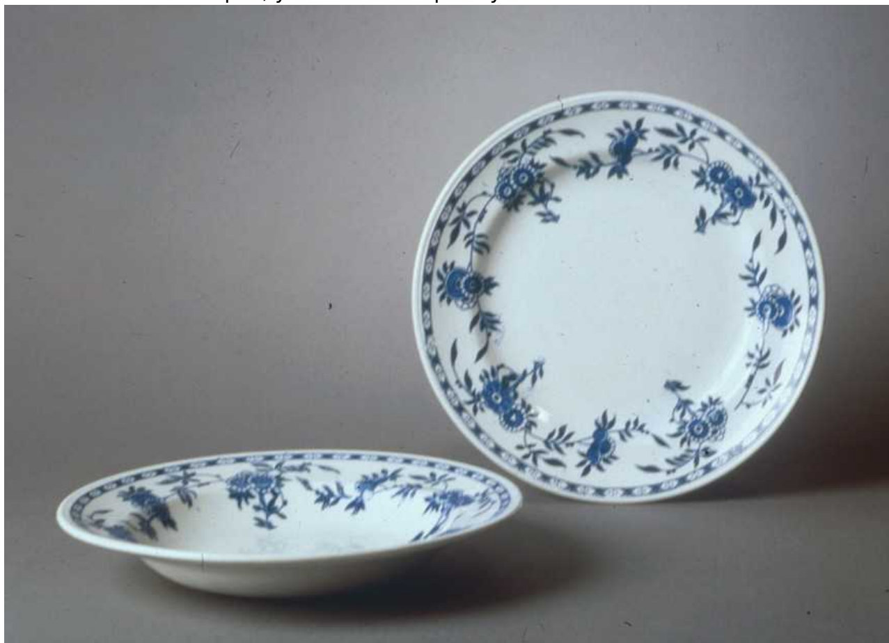
Посуда для пассажиров второго класса

Обломки «Титаника» лежат на глубине 3750 м. Впервые их обнаружила экспедиция руководитель лаборатории глубоководных исследований океанографического института в штате Массачусетс Роберта Балларда в 1985 году. 280 представленных в Женеве предметов были подняты – вместе с 5 500 другими – со дна океана американской компанией RMS Titanic, Inc., единственной, легально имеющей право на проведения поисков в зоне крушения лайнера. Путешествующую выставку, главными целями которой организаторы называют сохранение культурного наследия корабля и памяти его пассажиров, успели посмотреть уже 25 миллионов человек.