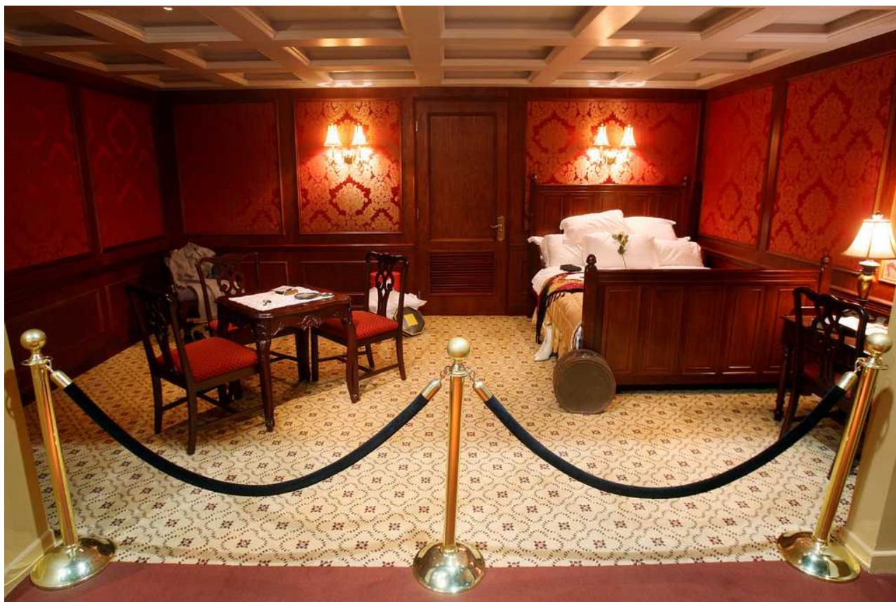
Кабина первого класса

В каютах второго класса, как правило, устанавливались двухъярусные кровати из красного дерева. Для возможности уединиться в постели над спальным местом висели шторы. Помимо кроватей в каюте имелись туалетный столик со складным умывальником, диван, платяной шкаф. Каюты второго класса были оформлены довольно однообразно: стены были обшиты покрашенными в белый цвет деревянными панелями, на полу стелился линолеум.