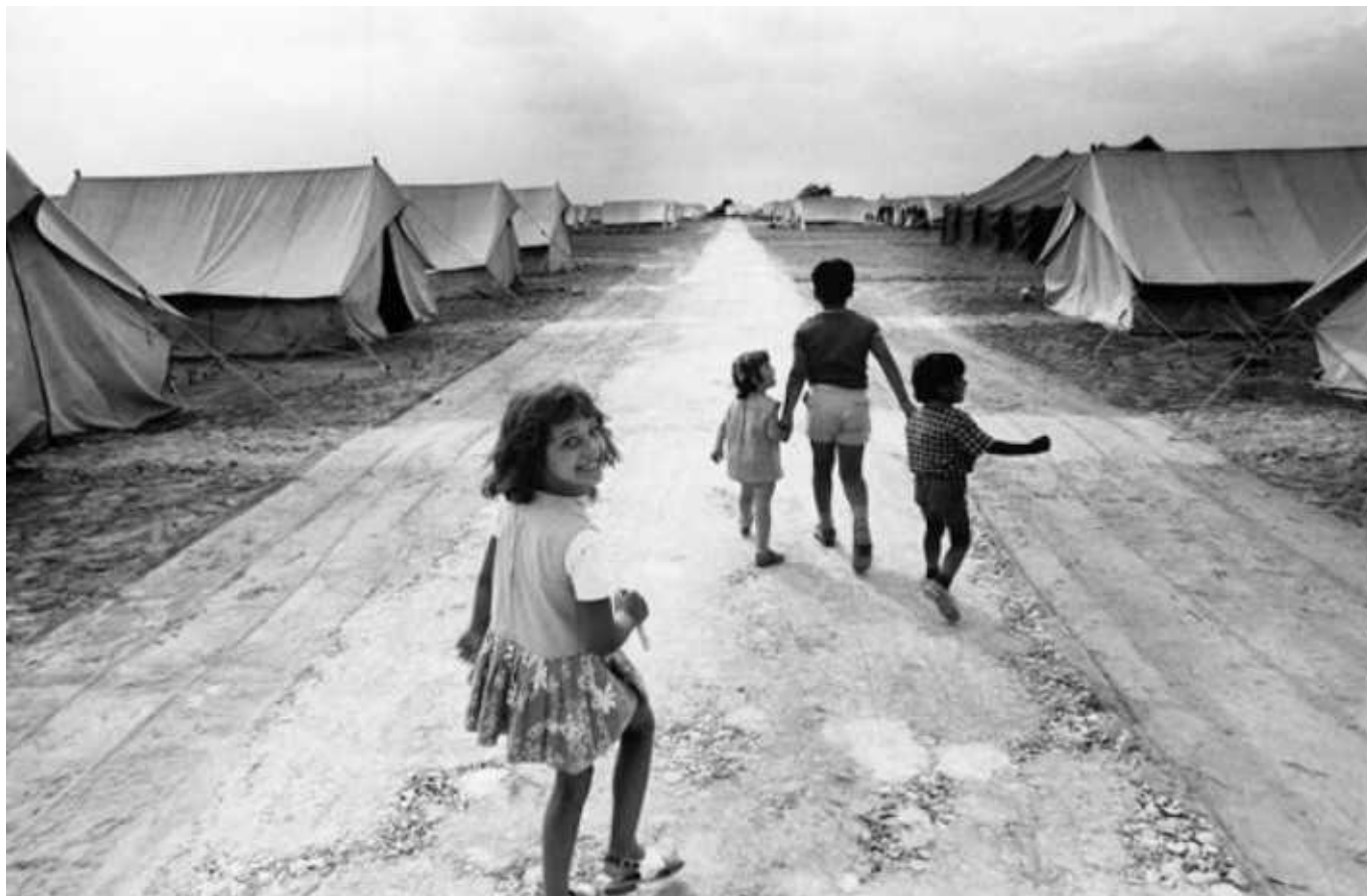
(© Jean Mohr)

Очевидно, что предварительное знакомство с фотографиями не вызвало восторга у турецких дипломатов, о чем они незамедлительно сообщили швейцарцам, потребовав отменить выставку. Подобная реакция турецкой стороны вполне закономерна: страна последовательно проводит политику непризнания ряда исторических фактов, включая, например, геноцид армян 1915 года. Удивление вызывает позиция Швейцарии, так легко согласившейся пойти на попятную.