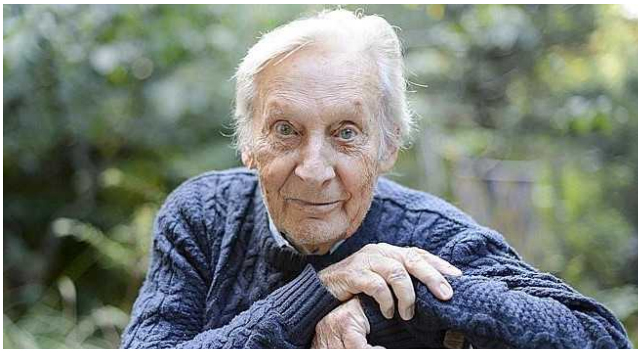
Жан Мор