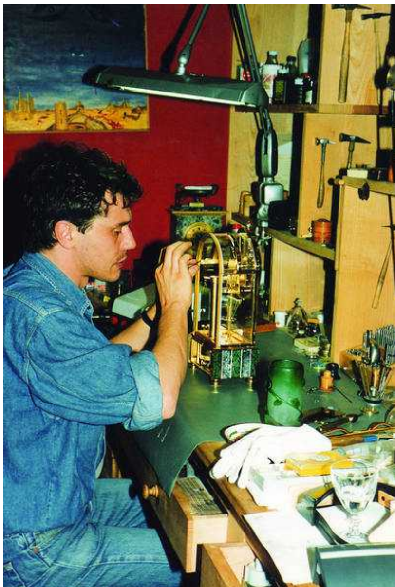
Ф.П. Журн в двадцатилетнем возрасте

Видя свою конечную цель в помощи молодым коллегам по созданию собственных брендов, руководство Академии прекрасно понимает важность их «вращения» в профессиональных кругах, контактов с прессой и возможности представить свои творения публике, коллекционерам и любителям. Вот почему начиная с 1987 года АНСИ активно участвует в самых различных выставках и ярмарках, не забывая главную – Базельскую. Инициативы учащихся Академии находят понимание и поддержку у старших товарищей, уже получивших заслуженное признание.