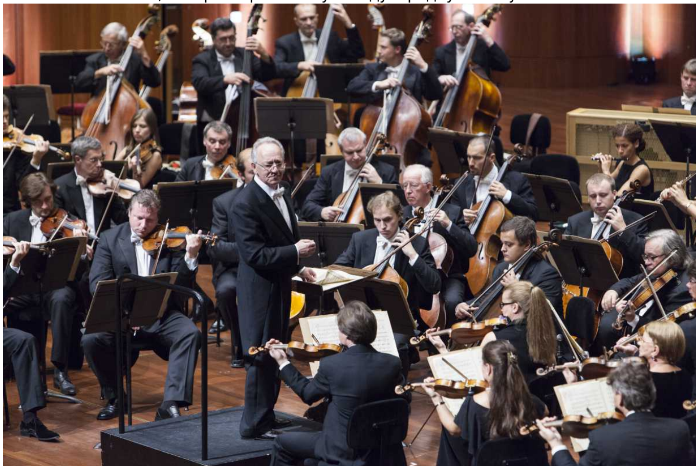
Юрий Темирканов со "своим" оркестром в Монтре, 2013 год