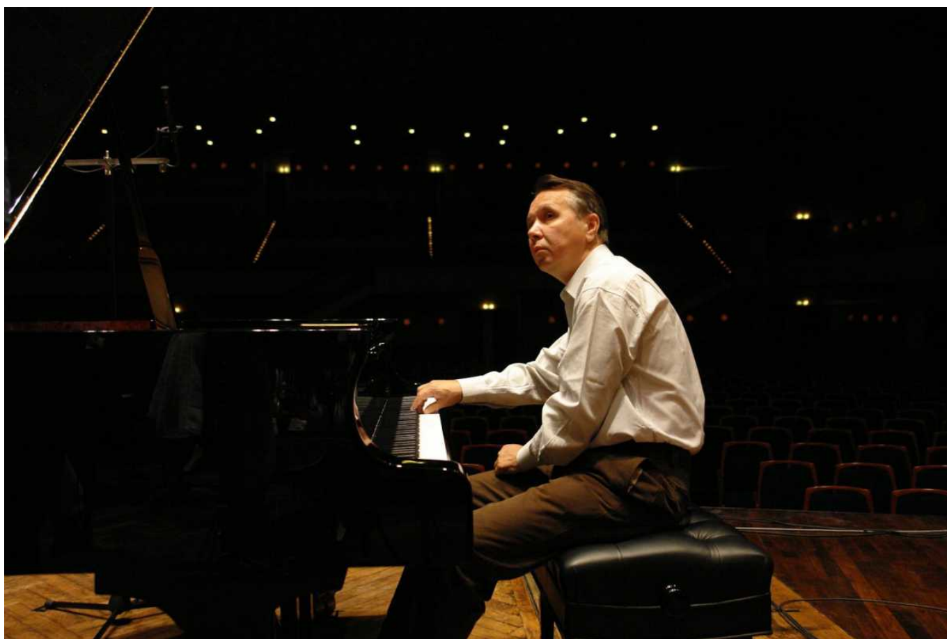
Михаил Плетнев на репетиции

К традиционным площадкам фестиваля (Аудиториум Стравинского, Театр Веве, Шильонский замок) прибавится в этом году Salle Del Castillo, расположенный на Рыночной площади Веве. Название этого зала, способного вместить оркестр для исполнения романтического репертуара XIX века, явно "отдает" Испанией. И это неспроста. Он был построен в 1907 году на деньги жившего в Веве испанского мецената, давшего городу 300 тысяч франков - сумму по тем временам громадную! Это зал очень любил живший неподалеку основатель Оркестра Романдской Швейцарии дирижер Эрнест Ансерме, сделавший здесь множество записей. Много лет зал простаивал без дела, но теперь он снова функционален. Правда, один недостаток остался - он недостаточно хорошо изолирован, и самый романтический момент может нарушить рев проезжающего по улице мотоцикла.