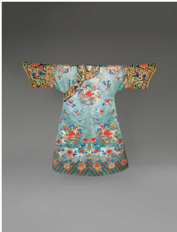
Платье из вышитого шелка