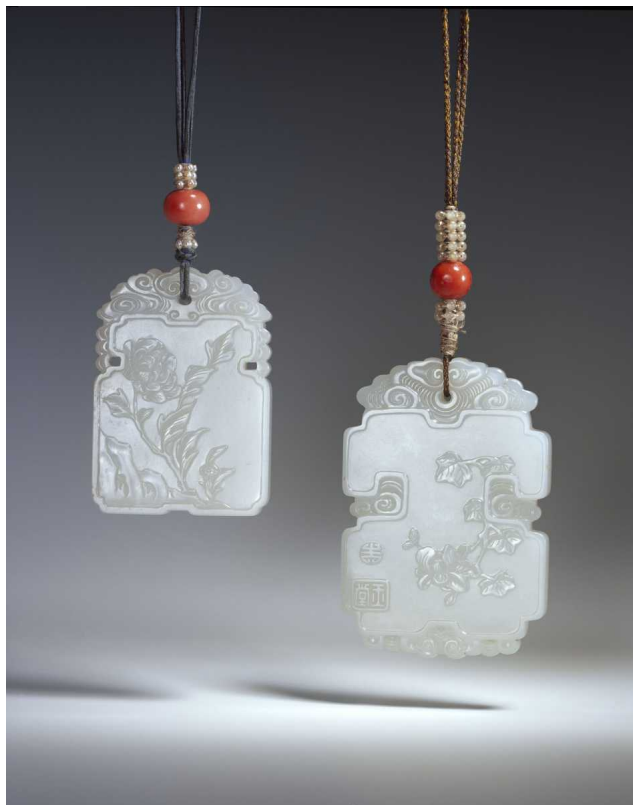
Нефритовые кулоны

За несколько лет до смерти Альфред приобрел элегантный особняк для размещения своих коллекций, которые он желал представить публике и которые составили основу будущего музея искусства Дальнего Востока. А в 1944 году коллекционер учредил Фонд Альфреда и Евгении Баур-Дюре, которому поручил управление музеем. Альфред стремился создать не просто музей, а настоящий храм искусства, где посетители смогут в свое удовольствие рассматривать восточные шедевры. Музей открыл свои двери в 1964 году, после значительной реконструкции особняка. Интерьеры украсили китайские ковры, английская, французская и китайская мебель, на стенах появились деревянные панели эпохи Людовика XVI, которые вместе с витринами из металла и красного дерева создали атмосферу уюта, столь важную для супругов Баур.