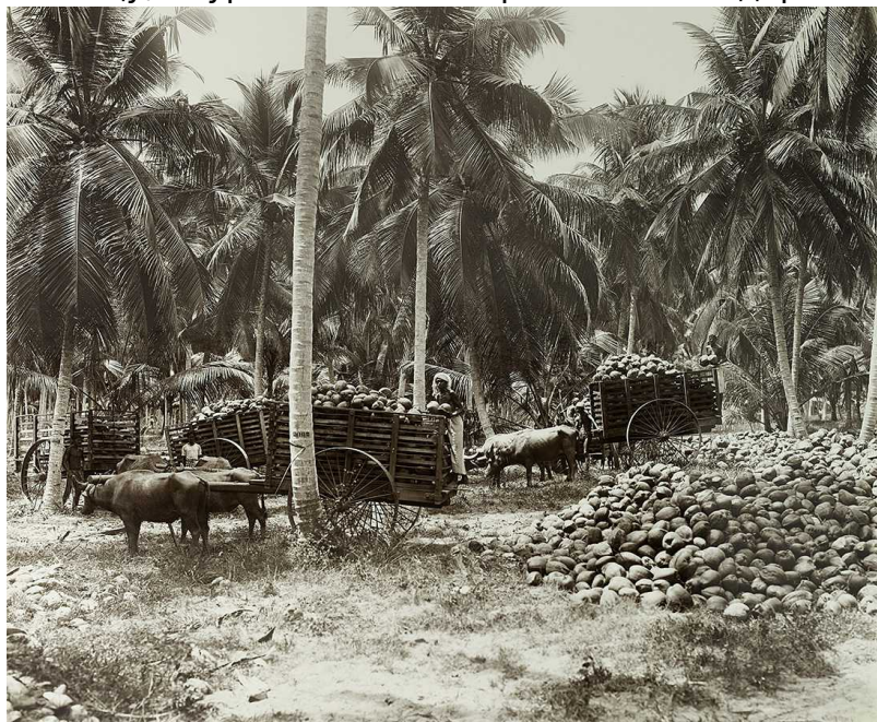
Сбор кокосовых орехов

Трудности перевозки урожая заключались в том, что британское правительство строило железные дороги в провинциях, производивших чай, но не развивало инфраструктуру в северо-западной части Цейлона. Чтобы доставить товары в столицу, Баур пользовался проселочными дорогами и старинными каналами.