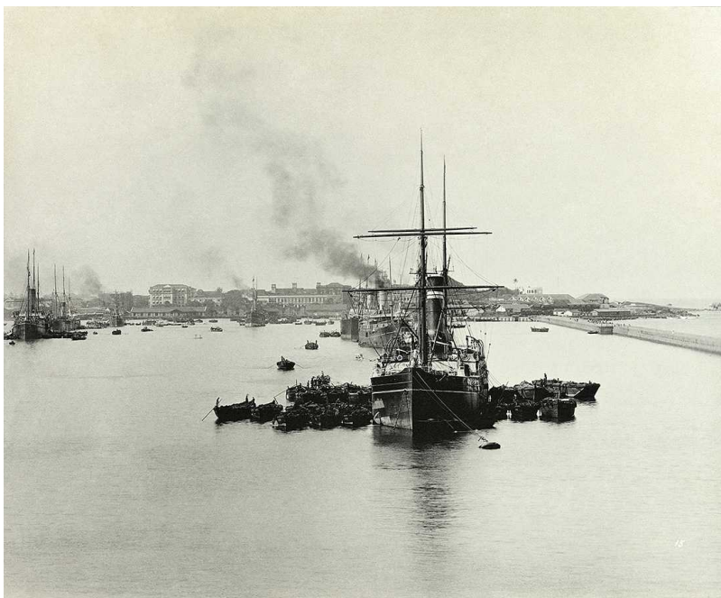
Порт Коломбо, конец XIX века