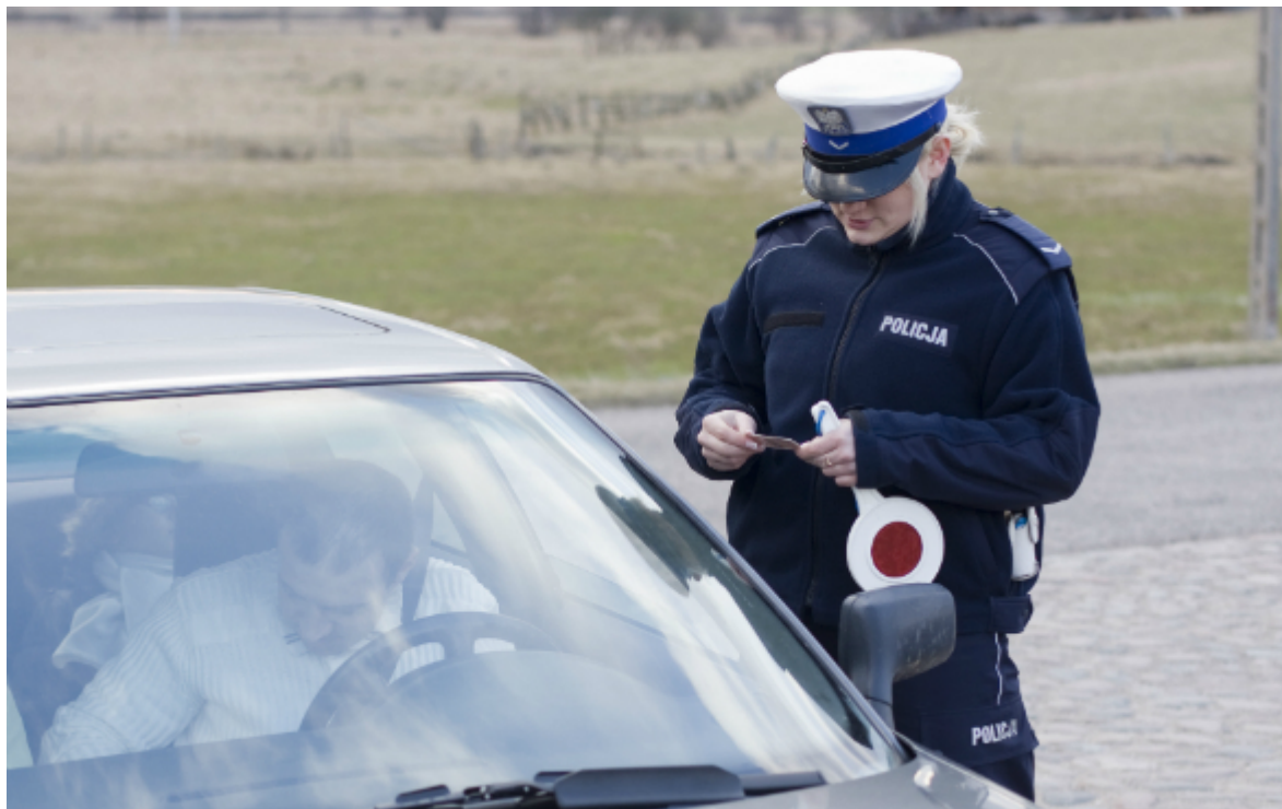
Совместный проект "Безопасность на дорогах" в Польше

В целом действующая система контроля доказала свою эффективность, считают эксперты, обращая внимание лишь на отдельные недостатки. В частности, при реализации одного из проектов в Венгрии контролирующими органами была пресечена попытка мошенничества на сотни тысяч франков. Этот случай не имел прямой связи с участием Швейцарии, поскольку в тот момент работы находились на стадии предварительного финансирования страной-партнером.