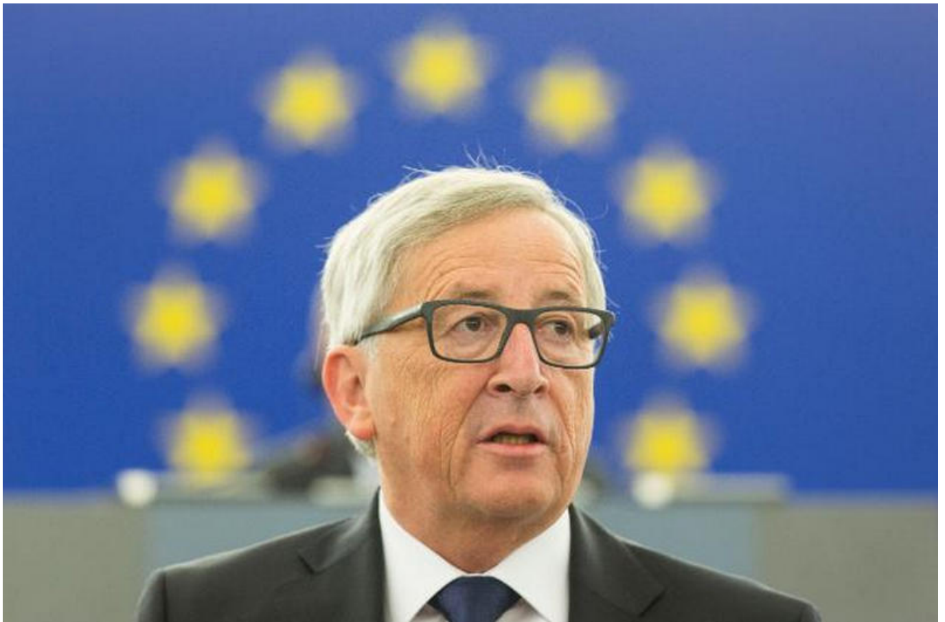
Жан-Клод Юнкер

Согласно предложенному механизму, который получил поддержку Европарламента, квоты на прием просителей приюта будут определяться в соответствии с численностью населения страны, размером ее ВВП, уровнем безработицы и числом беженцев, принятых в течение последних четырех лет. Страна, которая не сможет стать частью этого механизма «по уважительным и объективным причинам, таким как природная катастрофа», должна будет внести свой вклад в программу финансирования в размере 0,002% своего ВВП.