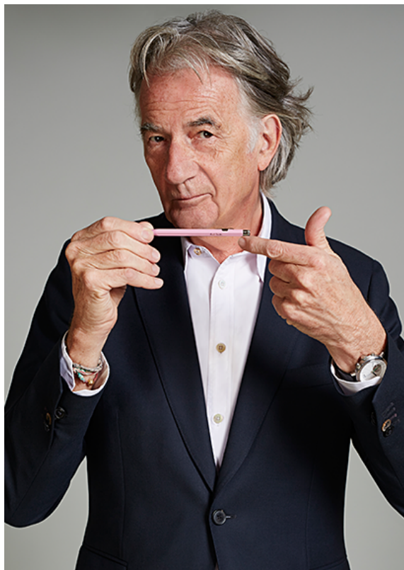
Пол Смит с авторучкой серии carandache 849 (carandache.com)

Британский дизайнер Пол Смит выпустил совместно со швейцарской фирмой Caran d'Ache , которая в этом году празднует столетие, праздничную коллекцию шариковых ручек знаменитой серии 849: «Paul Smith + Caran d'Ache». Всего произведено 10 экземпляров, каждый выполнен в шестигранном металлическом корпусе пастельных тонов и поставляется в подарочном футляре. Цена ручки – 40 франков.