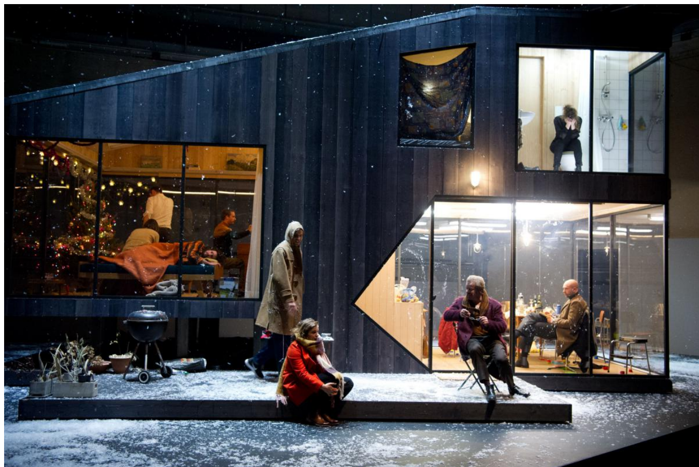
Сцена из спектакля "Три сестры"

Разгадка странной трактовки пьесы «Три сестры» наступает, когда вдруг начинаешь различать, что на кухне сценического дома в большом количестве присутствуют пакеты с продуктами из швейцарского магазина «Migros», и что сами герои, а не только их имена и одежда, - швейцарцы. Их лексикон, щедрые, беззастенчивые ругательства вслух - швейцарские, их простецкие грубоватые отношения с друг другом - швейцарские, их гендерная перепутанность, соответствующая тематика разговоров, открытые всем интимные отношения - тоже швейцарские.