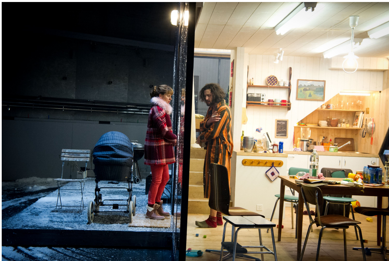
Сцена из спектакля "Три сестры"

Автор: Людмила Майер-Бабкина, Базель , 13.12.2016.