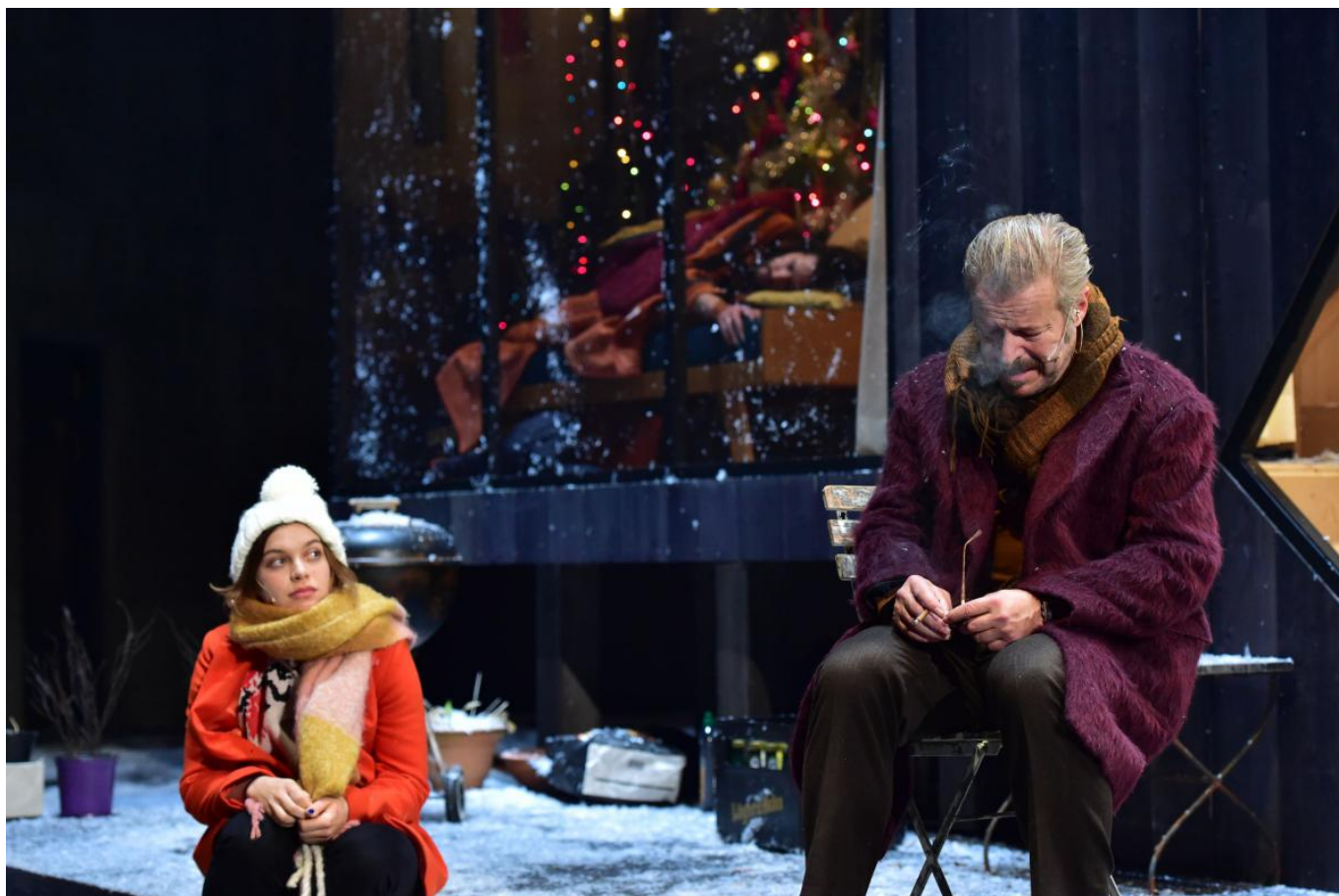
Сцена из спектакля "Три сестры"

Знаменитые чеховские паузы, «накрытые» повседневной скороговорной речью, по нашим наблюдениям «переместились» из диалогов персонажей на сцене в диалог публики с театром. Сценическое действие и погружение в финале в темноту заставили ставить вопросы, сравнивать, узнавать неприглядную правду о себе и, возможно, что-то пересматривать в своем образе жизни. Спектакль задел за живое многих. Об этом свидетельствовало напряжённое внимание зрительного зала и очень продолжительные аплодисменты: публика, не сговариваясь, аплодировала не только руками, но и, по-швейцарски слаженно и организованно, ногами... будто коллективно винясь и соглашаясь с театром.