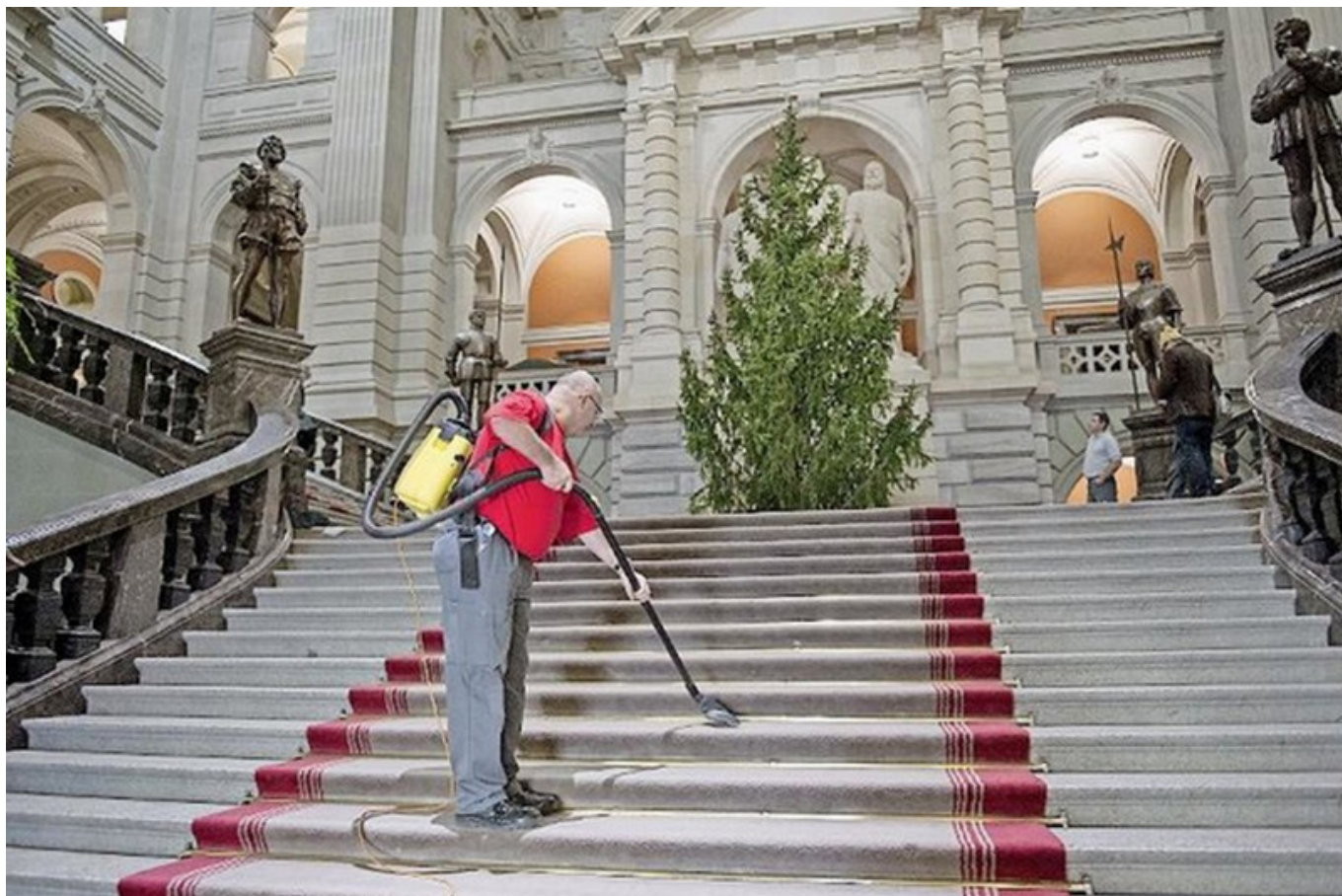
Последние штрихи