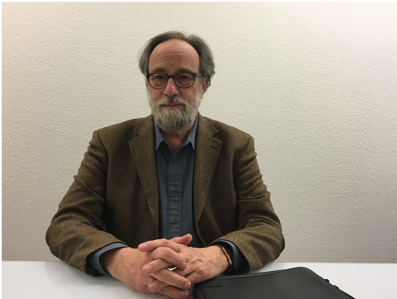
Посол Швейцарии Лоренцо Амберг (© Nashagazeta.ch)

Автор: Надежда Сикорская, Женева , 17.05.2017.