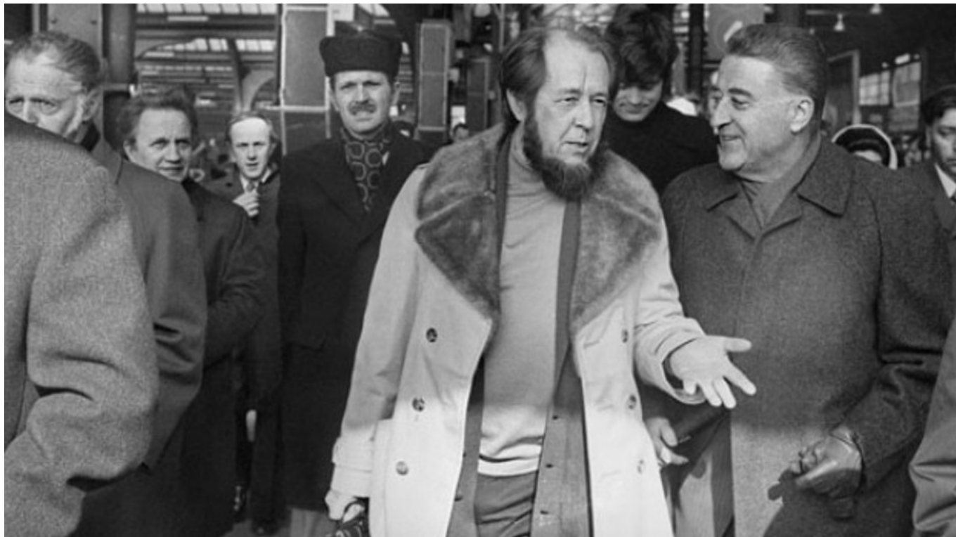
Александр Солженицын со своим швейцарским адвокатом Хеебом, 1974 г.

основой моей лекции. Двое из них отлично известны, это Пьер Жильяр и Жак-Алексис Ламбер. Книга Жильяра остается одним из лучших ключей к пониманию психологии царской семьи. В России они известны гораздо меньше. И уж точно неизвестны совсем обнаруженные мною записи учительницы начальной школы из Женевы Луизы Штелин, изданные в 1924 году в Лейпциге под названием «Унесенные бурей. Впечатления и судьба одной швейцарки в России 1914-1920 годов». Мне хочется процитировать одну фразу: «Наши сердца здесь практически разбились от боли, и, несмотря на это, мы любим русскую землю. Именно из-за пережитых здесь страданий, которые смягчили великодушное гостеприимство и отзывчивость жителей».