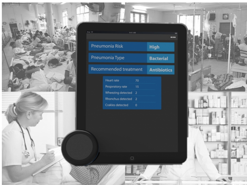
Смарт-стетоскоп в действии

«По мнению ряда экспертов, традиционный стетоскоп не очень удобен в использовании, а на его освоение требуется значительное время. Конечно, электронный стетоскоп существует уже давно, но сегодня его редко применяют в клиниках. Интеллектуальный прибор поможет сократить время обучения, необходимое для овладения техникой его использования, а также расширит возможности диагностирования, так как полученные данные можно будет отправлять коллегам для проведения консультаций», - рассказал Пьер.