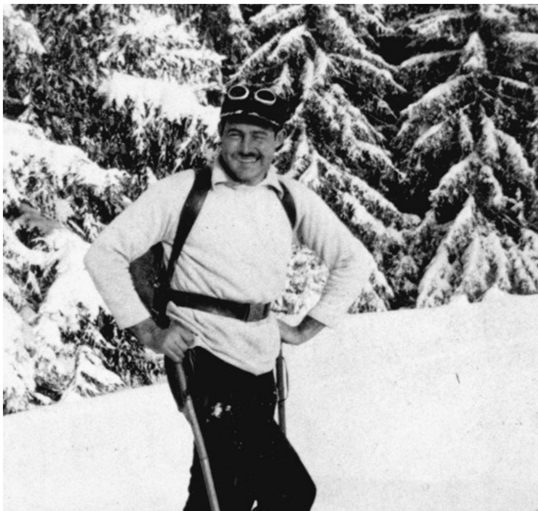
Эрнест Хемингуэй катался на лыжах в Гштаде в белом свитере

аристократы, бонвиваны, промышленники, звезды кино, в общем, представители высших слоев общества устремились на альпийские курорты. За ними последовала и мода.