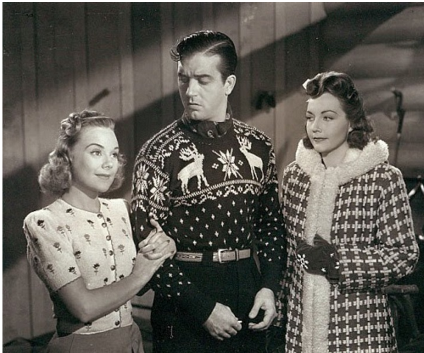
Кадр из фильма «Серенада солнечной долины»

Примечательно, что лыжный спорт в каком-то смысле содействовал и женской эмансипации. Сначала женщины катались на лыжах в юбках, но очень быстро сменили их на более удобные (и безопасные) брюки. Вскоре брюки пробрались из спортивного гардероба в повседневный.