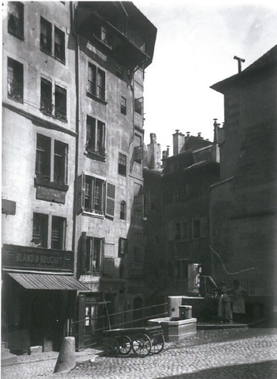
Харчевня Флакон, фотография 1884 года

На страдания вальденсов отреагировала протестантская Европа – помощь пришла из германских княжеств, Англии и Швейцарии. В результате политических интриг Виктор-Амадей был вынужден заключить мирное соглашение с подданными. «Капитан долин» (франц. «Capitaine des Vallées»), как окрестили Жанавеля его сподвижники, обосновался в городе Кальвина. Здесь он вел активную деятельность, стремясь помочь единоверцам, оставшимся в Пьемонте, где они по-прежнему чувствовали себя неуютно. Швейцарцы поддержали Жанавеля – протестантские кантоны, заинтересованные в распространении реформированных вероучений в Италии, назначили ему годовую ренту в размере ста серебряных экю.