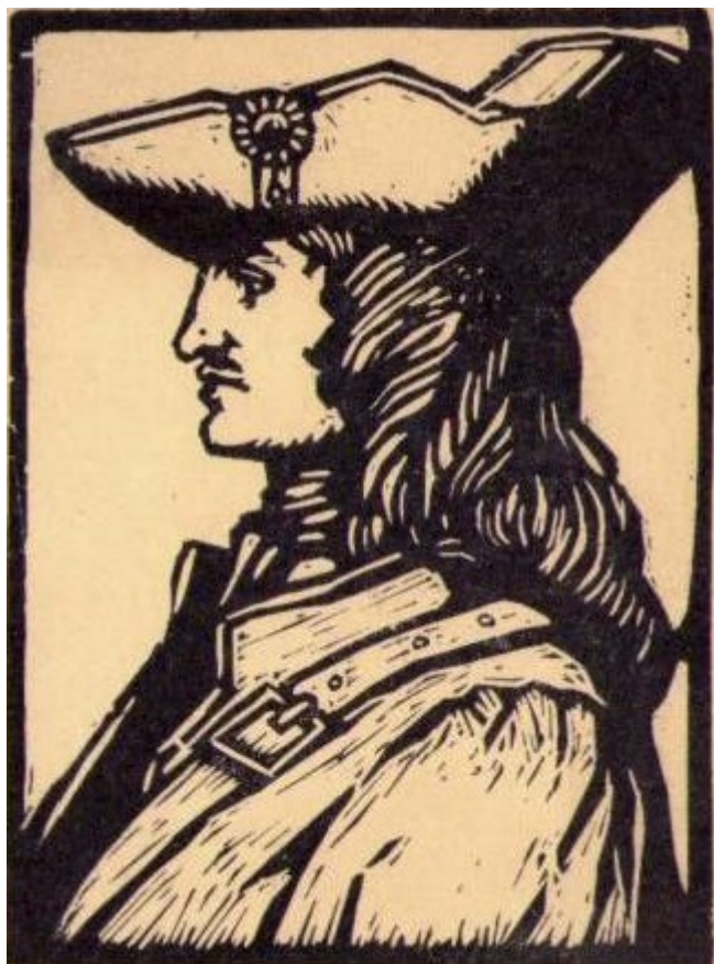
Жозуэ Жанавель – герой Пьемонта

северной Италии вальденсы вызывали подозрение у католических Савойи, Пьемонта и Франции.