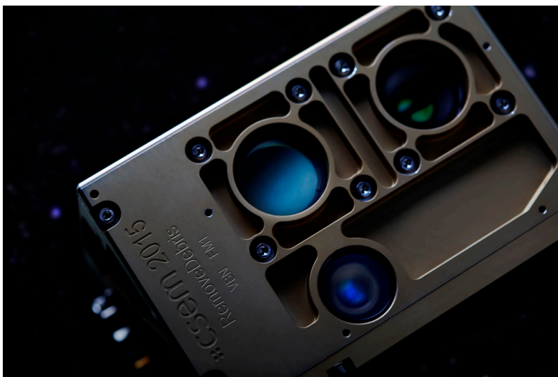
Система обнаружения, разработанная в CSEM (csem.ch)

Ученые намерены протестировать способы улавливания десятков тысяч космических обломков, используя сеть и гарпун. В этом случае большое значение имеет система наблюдения, которая позволит эффективно визуализировать цель. Спутник оснащен лидаром (активный дальномер) для получения 3D-изображений и цветной камерой. Система обнаружения была разработана специалистами CSEM в партнерстве с компанией Airbus и INRIA (Национальный институт исследований в области информатики и автоматизации, Франция). Работа ученых тем более актуальна, что обломки спутников и ракет, которые вращаются вокруг нашей планеты, могут повредить действующие аппараты.