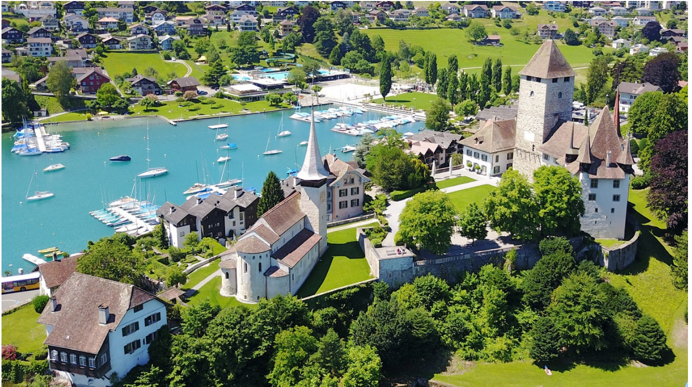
Шпиц – жемчужина Тунского озера.

человека, близко знавшие художника, поделятся своими воспоминаниями о нем.