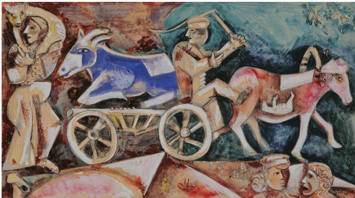
Марк Шагал. Торговец скотом, 1912, Gouache, 26,2 x 47 cm. Sammlung EWK

Посвященные Марку Захаровичу выставки проходят довольно часто, и его работы хранятся во многих музеях – большим числом полотен Шагала могут похвастаться, например, Цюрихский Кунстхаус и Базельский художественный музей, но выставка в замке Шпиц (нем.: Schloss Spiez) имеет особое значение сразу по нескольким причинам.