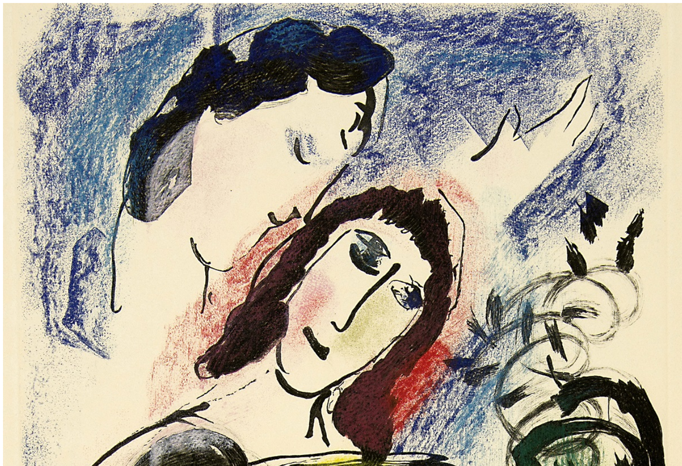
Марк Шагал. Желтый петух (фрагмент). Farbige Radierung, 1960. 45 x 28.5 cm. Sammlung EWK © 2019 ProLitteris, Zürich

Автор: Заррина Салимова, Шпиц , 28.06.2019.