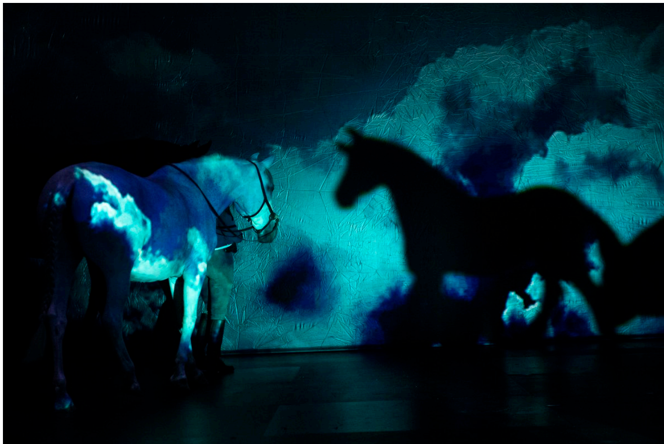
Сцена из спектакля «Эйнштейн на пляже» в Большом театре Женевы