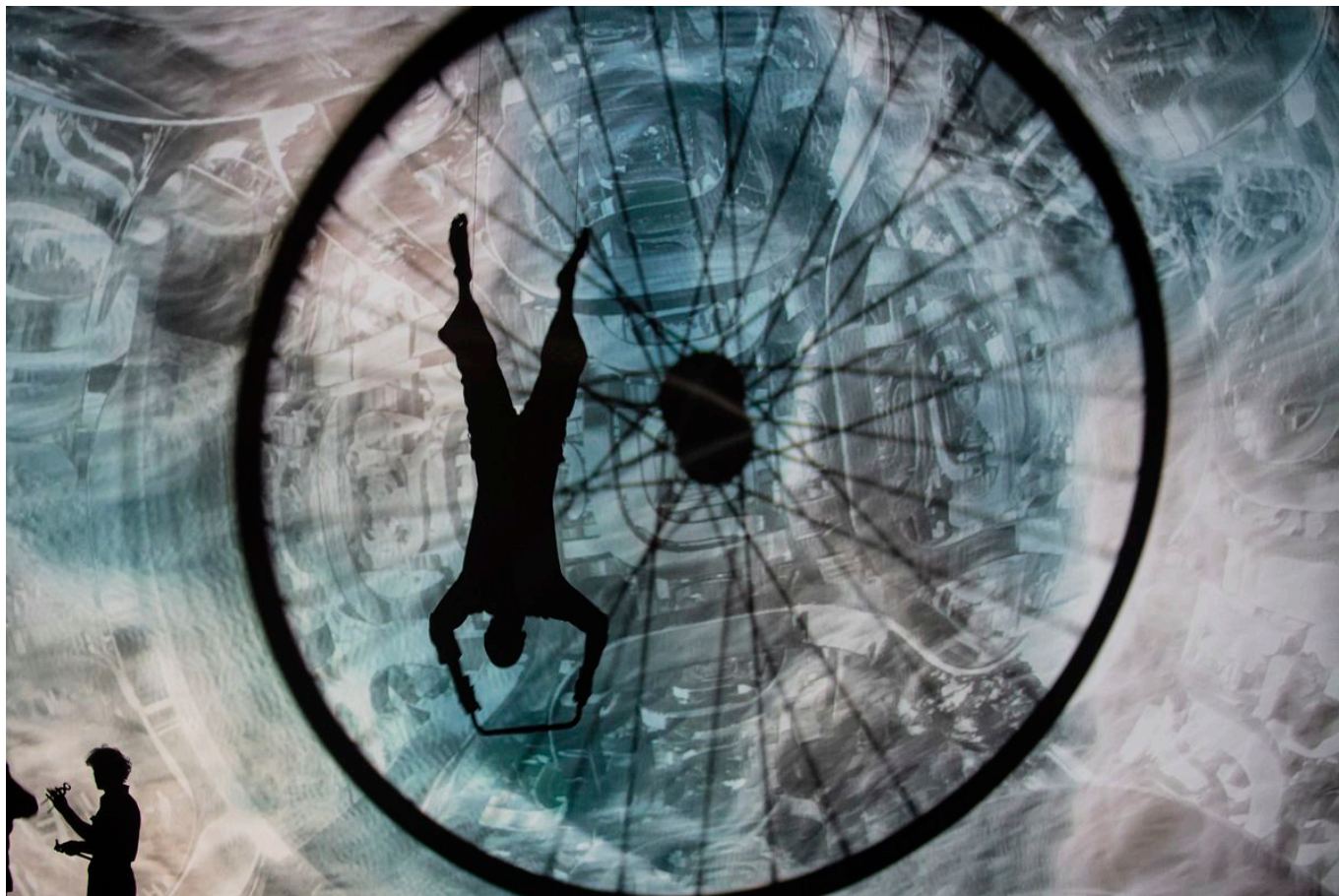
Сцена из спектакля «Эйнштейн на пляже» в Большом театре Женевы

Отсутствие сюжетной линии позволяет не только отлучаться из зала, не боясь что-то упустить, но и интерпретировать увиденное без «указаний сверху». Например, тема велосипеда, который летает над сценой, ездит по ней, появляется то с двумя покрышками, то с одной, возникает в виде огромного одинокого колеса на заднике сцены, обращенного в экран. И все крутится, крутится, крутится... Можно понять это прямолинейно – Эйнштейн любил кататься на велосипеде, вот велосипед. Можно чуть поднять планку: велосипед – аллюзия на изобретение Эйнштейном физического «колеса», эта метафора одинаково работает и по-русски, и по-французски. А можно и совсем уйти в философию и представить себе, что крутящиеся окружности колес – это «восьмерка», символ бесконечности.