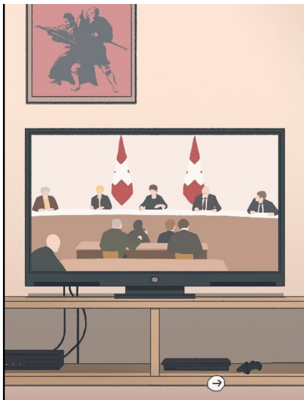
Пресс-конференция Федерального совета