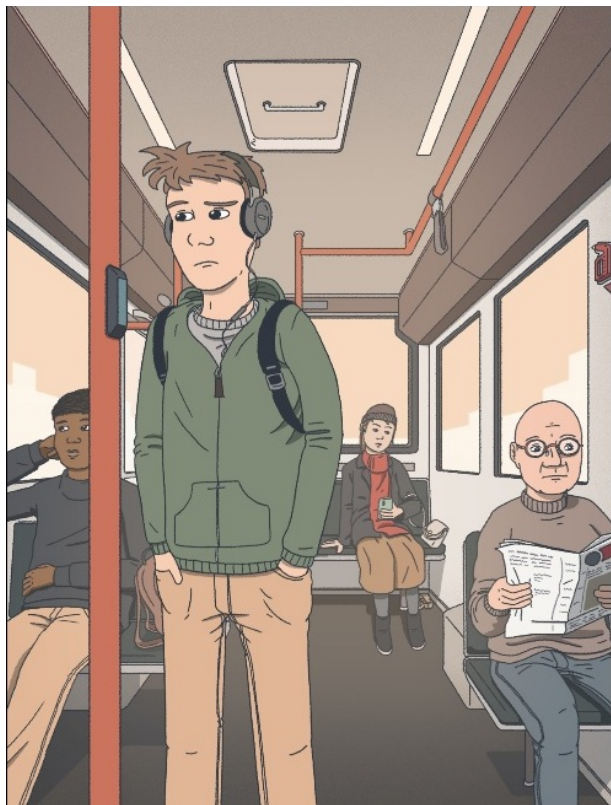
По пути домой (март 2020 года)

Новая игра, представленная 20 августа – это собрание эпизодов из жизни разных людей, которое дает возможность иначе прочувствовать события, имевшие место весной 2020 года. Некоторые сцены покажутся игрокам знакомыми, другие могут стать неожиданностью. Игра разочарует любителей шутеров, где вспыхивают взрывы и гремят автоматные очереди, так как напоминает квест, хотя и очень отдаленно. Точнее всего будет назвать ее интерактивным комиксом, где можно нажимать на отдельные предметы, слушать радио, читать книги, звонить родственникам или друзьям. Также присутствуют мини-игры – поход за покупками, онлайн-уроки и т.д. Следя за событиями, разворачивающимися на экране, участники узнают, какие меры принимал Федеральный совет, а также смогут сопереживать персонажам, представителям разных поколений.