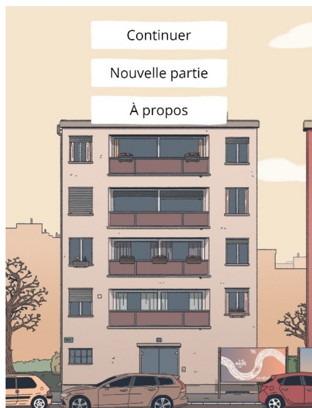
Дом, в котором живут герои игры