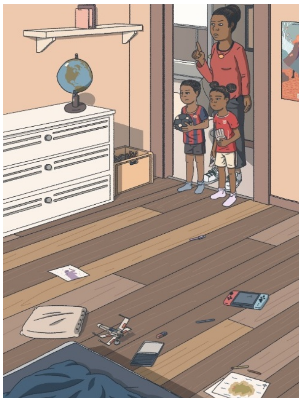
Уборка в детской комнате