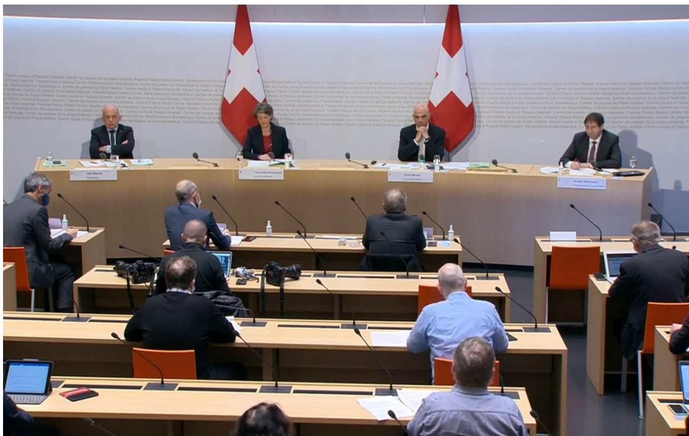
Скриншот брифинга от 11 декабря

Автор: Заррина Салимова, Берн , 11.12.2020.