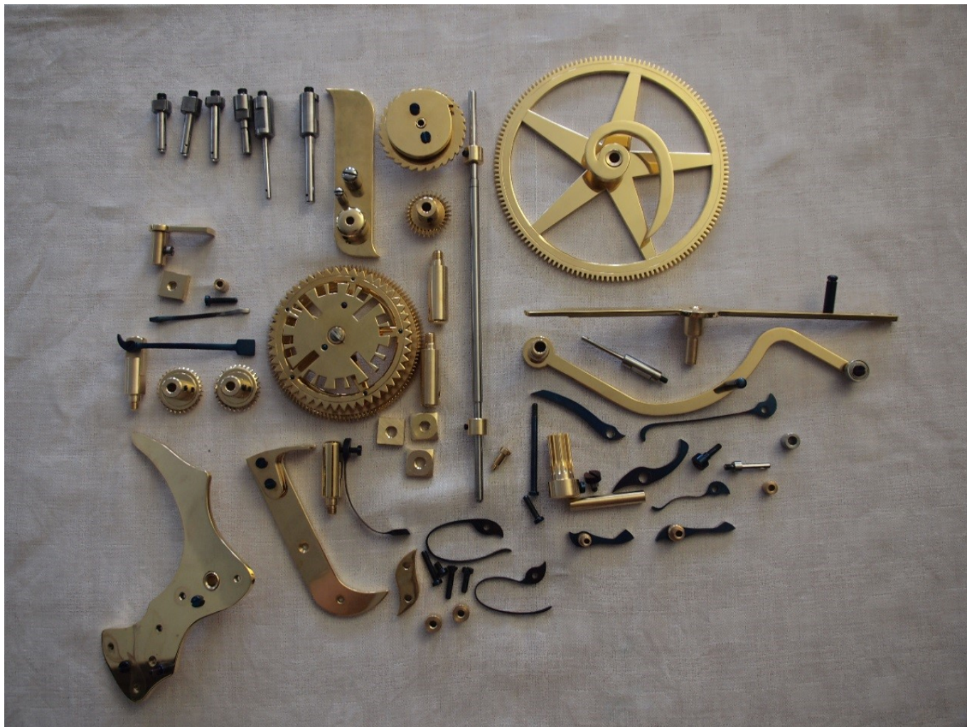
Детали Kalender Perpeten

Внутренняя часть колеса имеет 97 подъемов. Кончик «щупа» вечного календаря касается колеса каждый февраль. Если он попадает в выемку, то часы переходят с 28 февраля на 1 марта, а если он остается на одном из 97 возвышений, то механизм перемещается с 28 февраля на 29 февраля, а затем на следующую ночь – на 1 марта. Григорианский календарь основан на 400-летнем цикле, и после одного оборота колеса процесс начинается снова. Владельцу часов никогда не придется устанавливать дату.