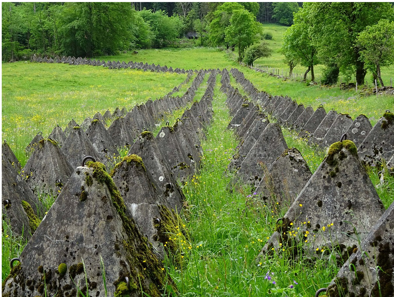
«Тоблероны» в Виммисе.

Автор: Заррина Салимова, Виммис , 22.06.2021.