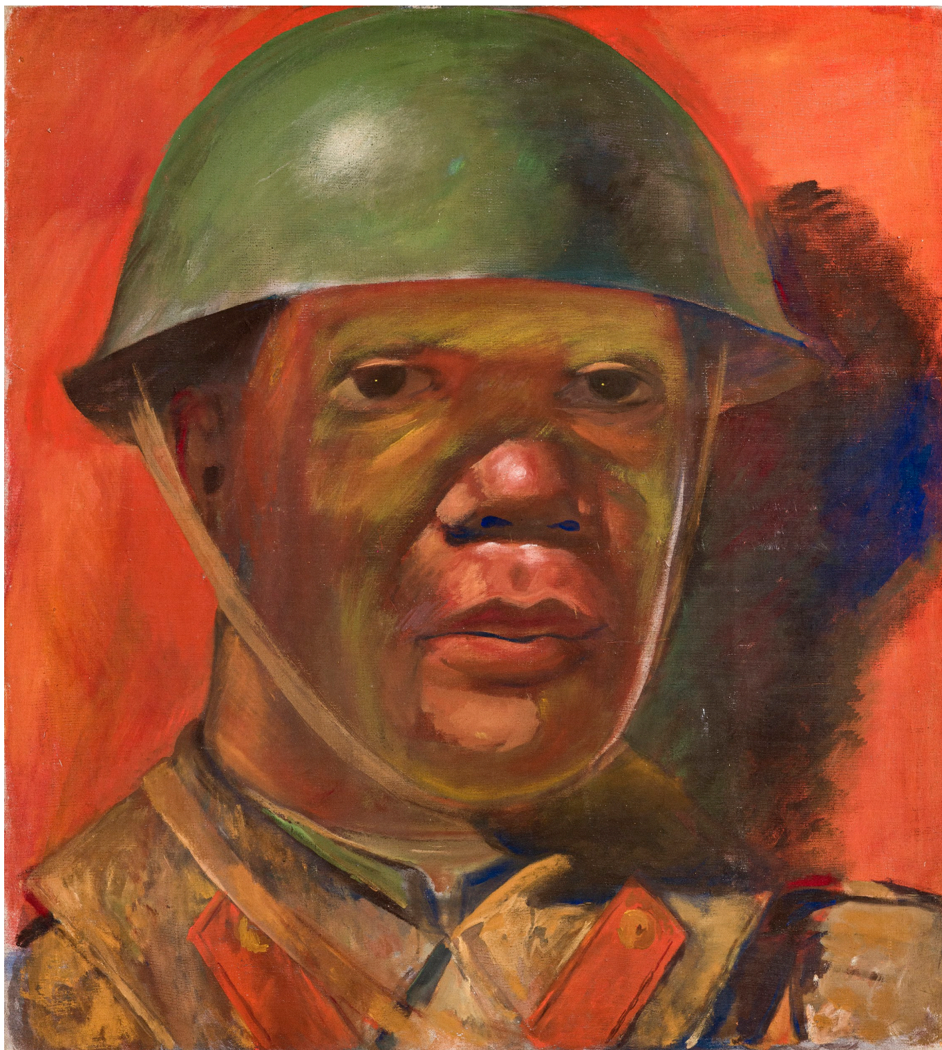
Василий Иванович Шухаев (1887-1973), Портрет солдата, масло на холсте

Этот живописец, график и художник театра учился в Строгановском художественно-промышленном училище в Москве (1897-1906), а затем в Высшем художественном училище при Академии художеств (1906-1912) у Д. Н. Кардовского. «Точный академический рисунок, гладкая живопись, симметричная композиция полотна были своеобразной реакцией на эксперименты, происходившие в искусстве тех лет, - читаем мы в справочной литературе. - Театральность и ретроспективизм его произведений были близки художественным принципам мастеров «Мира искусства», в выставках которого художник принимал участие». Преподавал в Новой художественной мастерской в Петрограде (с 1915 года), в знаменитом Центральном училище технического рисования барона А. Штиглица. Профессор Высшего