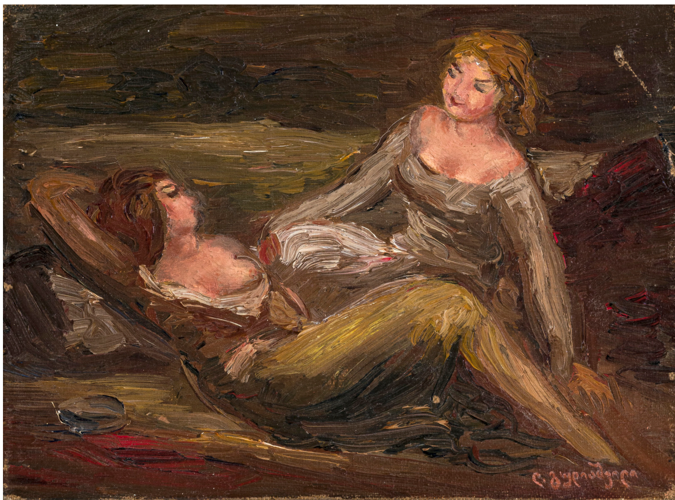
Лад Гудиашвили (1896-1980), Разговор, масло на холсте, подпись, 19х26 см

Лад (Владимир) Давидович Гудиашвили родился в 1896 году в Тифлисе, а умер в 1980-м в Тбилиси. В отличие от Бажбеука-Меликова, признание пришло к нему при жизни – этот художник-живописец, график, монументалист и педагог был удостоен званий Народный художник СССР (1972) и Герой Социалистического Труда (1976) и стал первым лауреатом Государственной премии Грузинской ССР им. Руставели, в 1965 году.