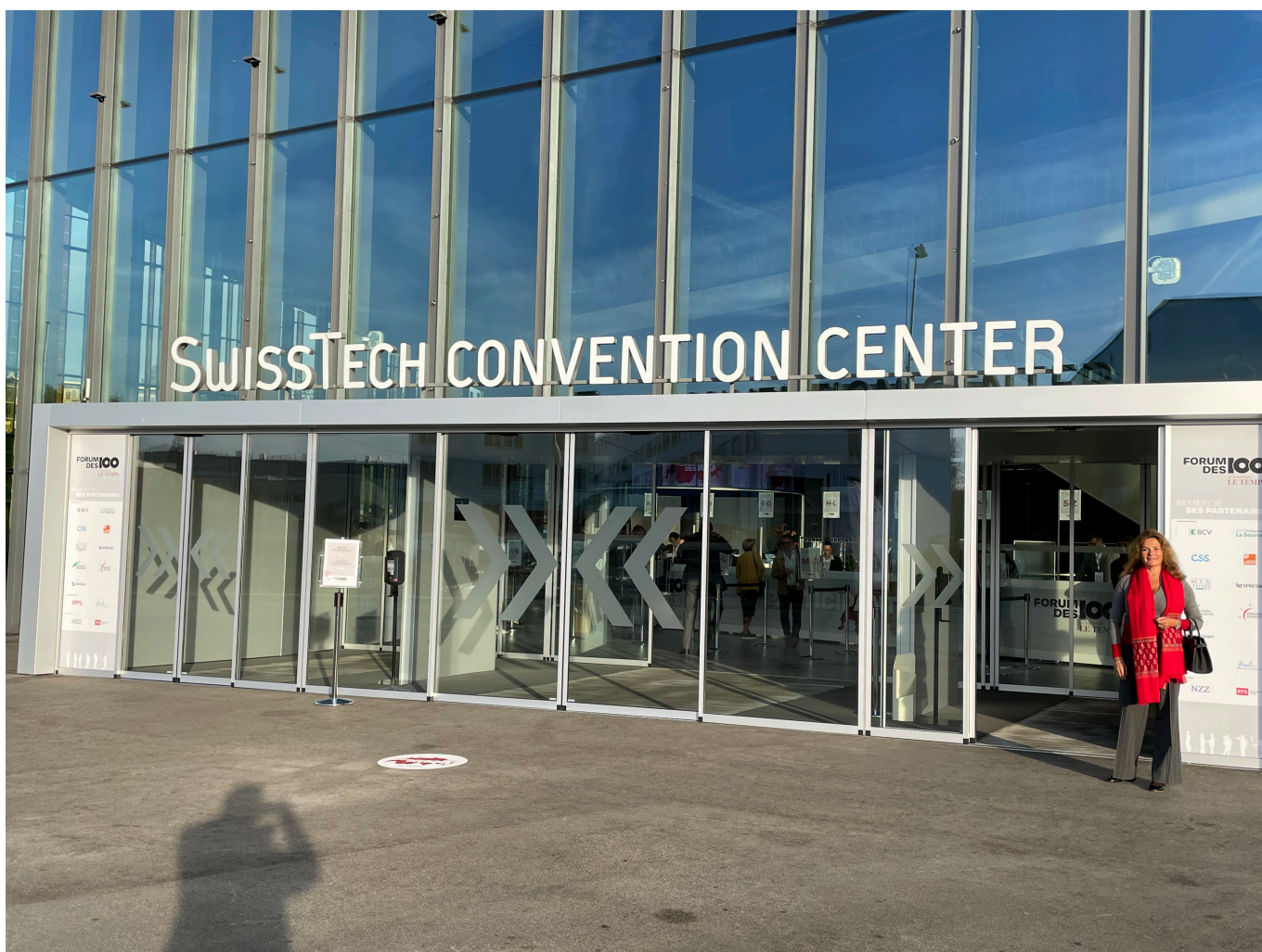
Надежда Сикорская у входа в Технологический центр EPFL

Автор: Надежда Сикорская, Лозанна , 13.10.2022.