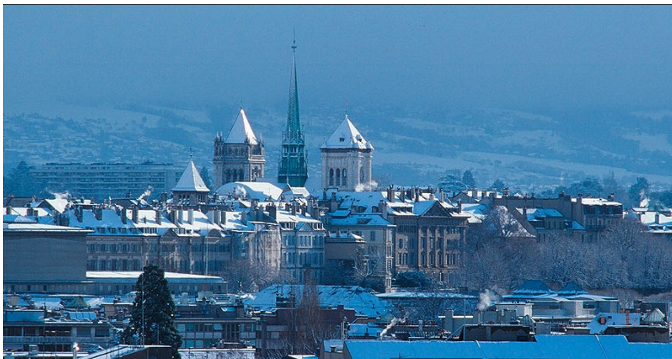
Женевский собор св. Петра зимой

Автор: Надежда Сикорская, Женева-Лозанна , 13.12.2022.