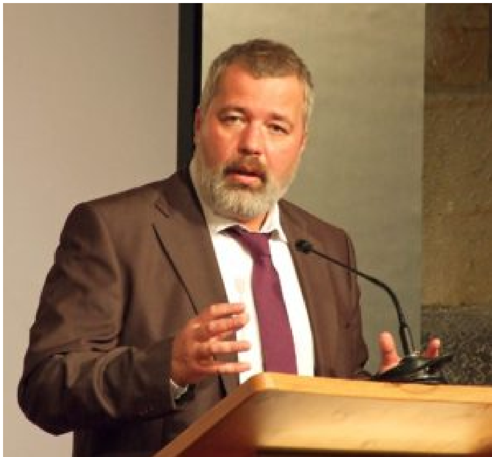
Dmitry Mouratov

La seule et brève mention de l'attribution du Prix Nobel de la Paix au journaliste russe Dmitri Mouratov a provoqué une avalanche de « likes » sur la page Facebook de Nasha Gazeta, ainsi qu'un vif échange d'opinions.