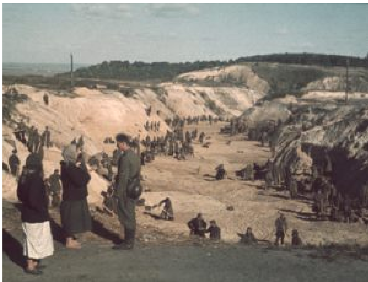
Les prisonniers de guerre soviétiques couvrent la ravine après le massacre sous les ordres des Nazi. Regardez la taille de cette ravine! 1 octobre 1941

Je ne sais pas pourquoi mais c'est cette liste qui m'a le plus touchée dans le film. Peut-être à cause de strudel , qui a évoqué les souvenirs d'enfance bien que ma tante de Kiev le fît aux merises, et je n'ai jamais rien mangé d'aussi bon depuis ! En lisant cette liste donc je me suis donc posé une question, LA question peut-être : comment est-ce possible que des gens qui ont cohabité pendant des décennies avec d'autres, leur achetant du pain, leur empruntant du sel et des livres, allant chez eux pour soigner leurs dents, emmenant chez eux leurs enfants pour les leçons de musique, leur commandant leurs robes de mariée, soudainement ne les reconnaissent plus et observent sans émotion leur souffrances et leurs morts ? Comment est-ce possible ?! Bien sûr, je ne parle pas pour tout le monde, je vise seulement cette grande majorité dont le nom est la Foule anonyme.