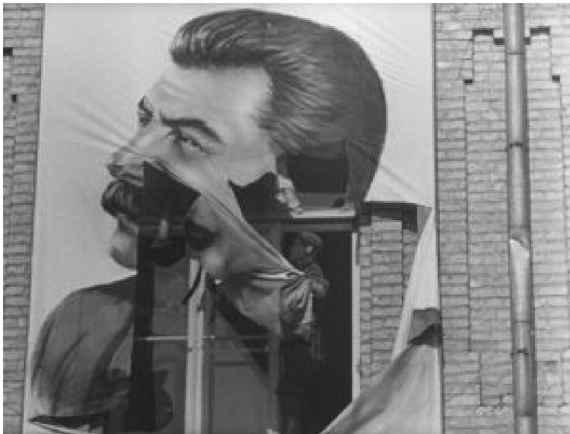
Sergeï Loznitsa "Babi Yar. Contexte"

Aujourd'hui et demain le festival de films indépendants Black Movie présente un documentaire du réalisateur ukrainien Sergei Loznitsa, déjà connu du public genevois grâce à ses « Victory Day » et « Funérailles d'État ».