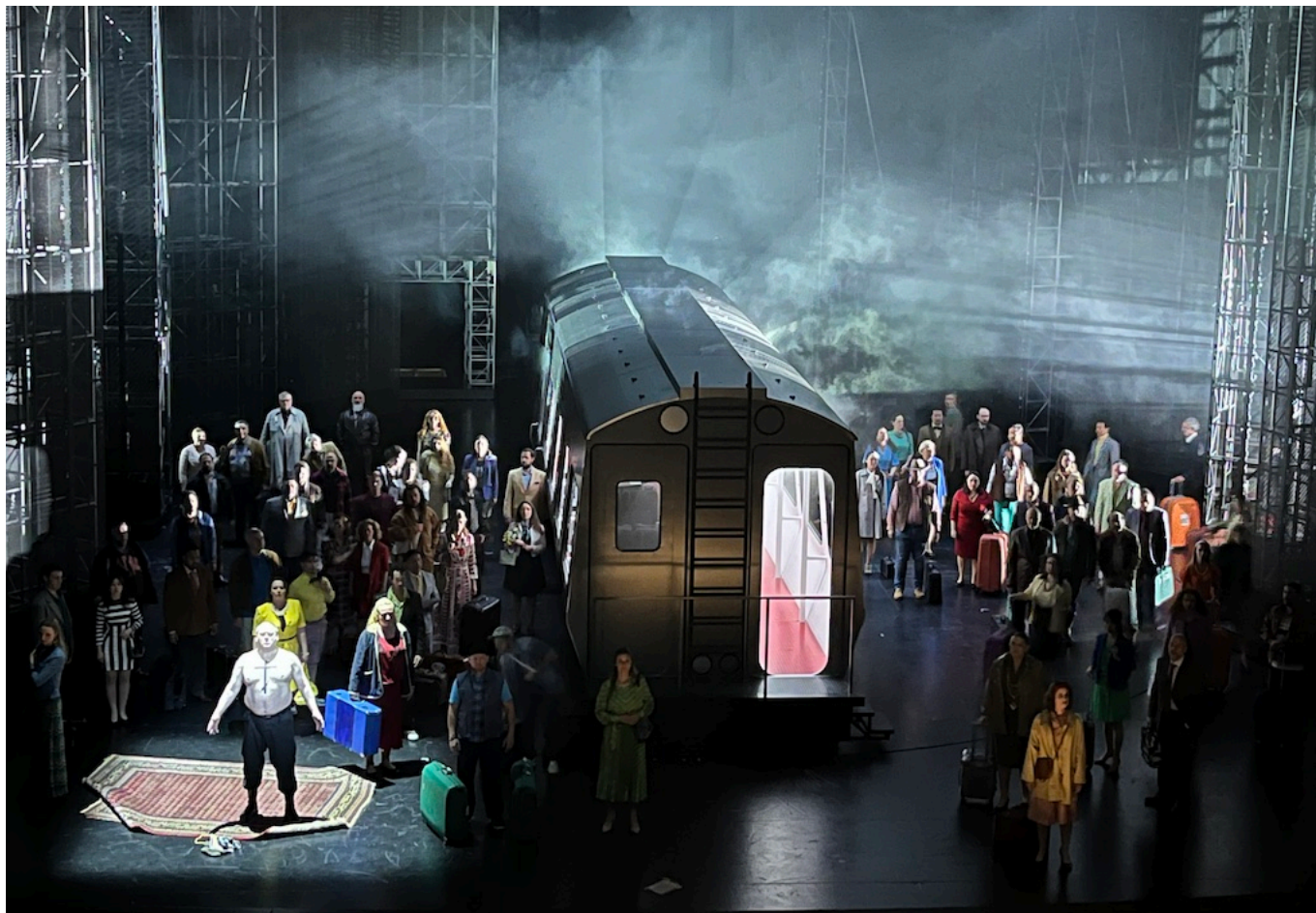
Финал оперы "Хованщина".

Не думаем, что эта постановка войдет в число «нетленок». А вот сама опера вовсе не утратила актуальности. Очень жаль, что авторы спектакля не уделили большего внимания работе солистов и артистов хора с текстом, имеющим огромное значение. Но русскоязычный зритель наверняка разберет обращенные к толпе слова Хованского «Дети, дети мои! Москва и Русь (спаси Бог!) в погроме великом...», и «считает» упрек Голицына Хованскому «Мы теперь местов лишились, Ты же сам нас уладил, князь, с холопьем поровнял», и стенания Шакловитого, оплакивающего участь Руси («Спит стрелецкое гнездо, спи, русский люд, враг не дремлет»), и предупреждение «Литва проснулась!», и констатацию Иваном Хованским «и так уж на Руси великой не весело, не радостно живётся», и растерянность «пришлого люда», наблюдающего в финале за тем, как горят основные персонажи «Ох ты, родная матушка Русь... Кто же теперь тебя, родимую утешит, успокоит?..» Этот последний вопрос остается открытым. И нужно ли что-то добавлять к контексту?