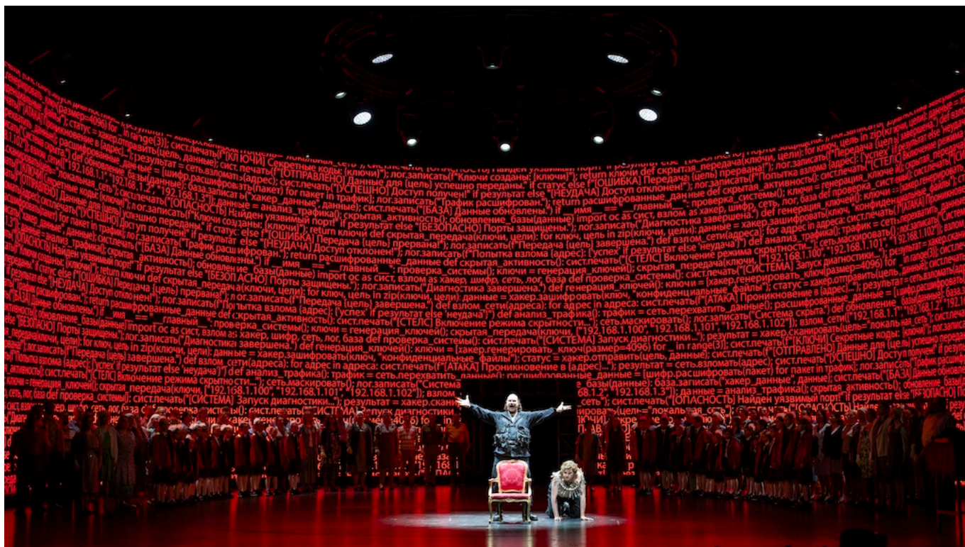
Хакерская вязь

Наши читатели понимают, конечно, что именно период властвования князя Хованского породил слово «хованщина», с этой самой «щиной» (суффикс+окончание), которая используется при создании собирательных существительных, нужных для обозначения явления, причем обычно с негативной коннотацией. Вспомним навскидку: военщина, гапоновщина, дедовщина, матерщина, ежовщина, уголовщина, поножовщина. Примеров много, только не надо ставить в один ряд с ними «Смоленщину» из стихотворения Константина Симонова – это другая опера. (В опере Мусоргского авторство приписывается непосредственно Петру – на вопрос Досифея, что сказал царь Петр, Шакловитый отвечает: «Обозвал «хованщиной» и велел сыскать».) Все эти слова столь же труднопроизносимы для иностранцев (одну русскую букву «щ» обычно изображают три или четыре латинские), сколь труднопонимаемы обозначаемые ими понятия. Что приводит к самым разным трактовкам отдельных периодов русской истории вообще и оперы Мусоргского в частности.