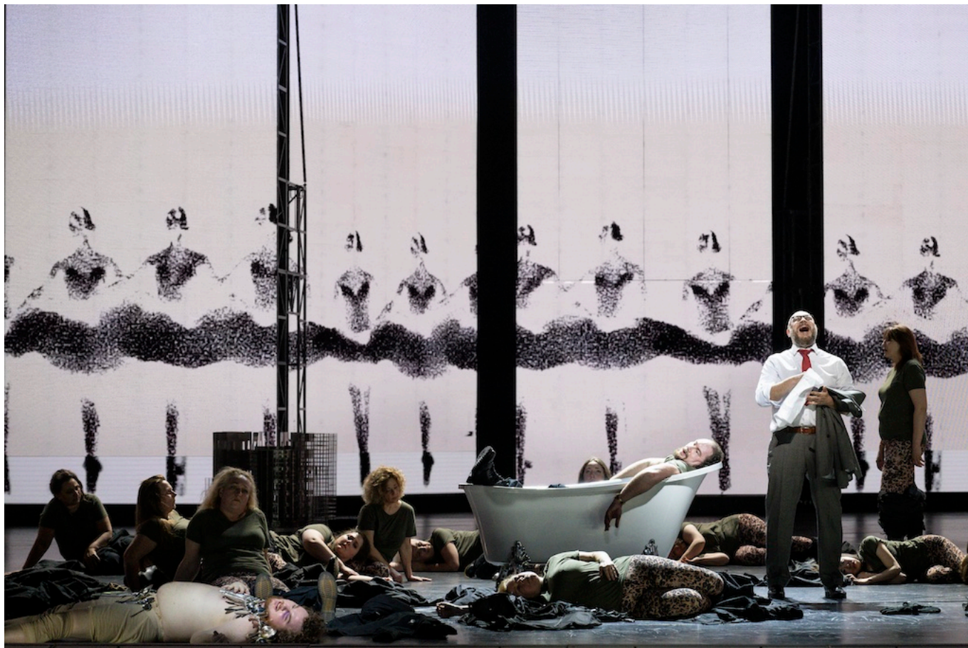
Шакловитый (Владислав Сулимский) сделал свое дело